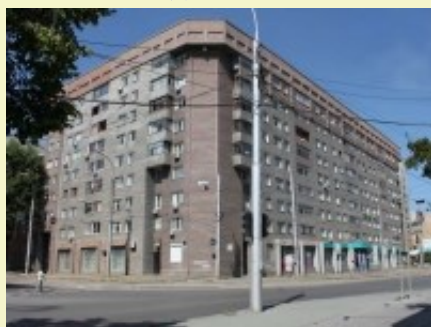
Орджоникидзе 33, многоквартирный дом, где располагается Новосибирское отделение Союза писателей России