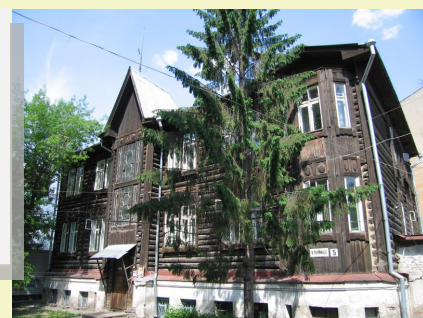
Жилой многоквартирный дом в стиле «деревянный модерн». Построен в 1920-х годах.