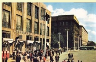
Красный проспект, 29, 38 и Орджоникидзе, 27. 1960-е годы